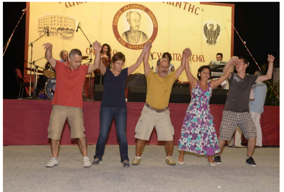
Εντυπωσιάσε με τα χορευτικά της η αποστολή των Ποντιόφωνων Μουσουλιμάνων