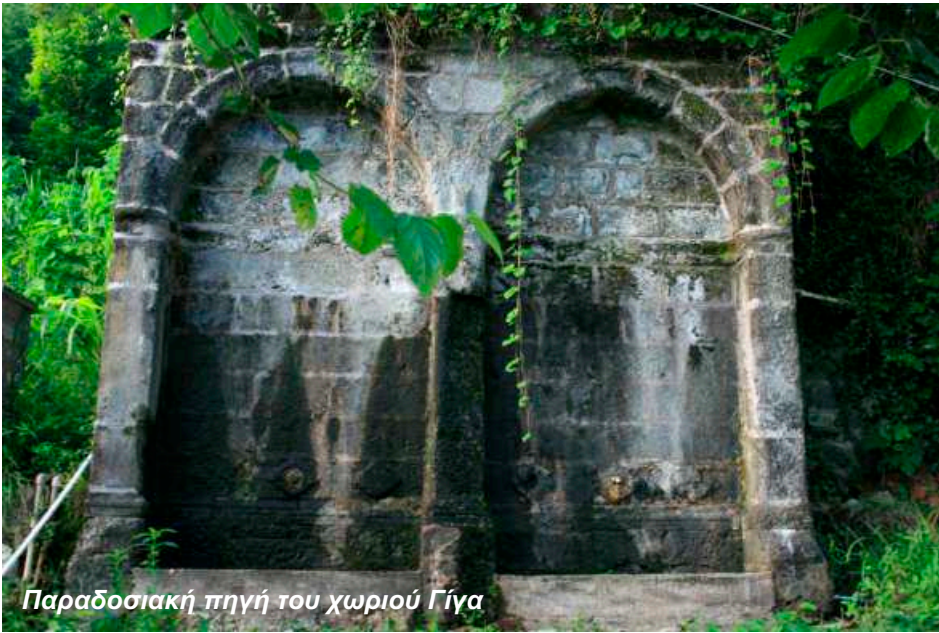
Παραδοσιακή πηγή του χωριού Γίγα