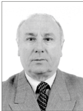
του ΗΛΙΑ ΣΠΑΝΟΥ

Από τους τρεις Μηλιώτες λόγιους ο λιγότερο γνωστός είναι ο Δανιήλ Φιλίππιδης, παρόλο που το συγγραφικό του έργο είναι πλουσιότερο και με τεράστιο επιστημονικό ενδιαφέρον. Αυτό ίσως να οφείλεται στο ότι έζησε το μεγαλύτερο μέρος της ζωής του μακριά από τον τόπο του, στην Ρουμανία, στο Παρίσι και Βιέννη. Η παιδεία του Φιλίππιδη ήταν ευρύτατη. Ξεκινώντας από το σχολείο του χωριού του, συνέχισε τις σπουδές του στην περίφημη σχολή της Ζαγοράς, έγινε ιερομόναχος, αλλάζοντας και το όνομά του από Δημήτριος σε Δανιήλ, και έφυγε για το Άγιον Όρος, ώστε να παρακολουθήσει μαθήματα στην Αθωνιάδα Σχολή, και αργότερα σπούδασε στη Σχολή του Αγίου Μηνά στην Χίο.