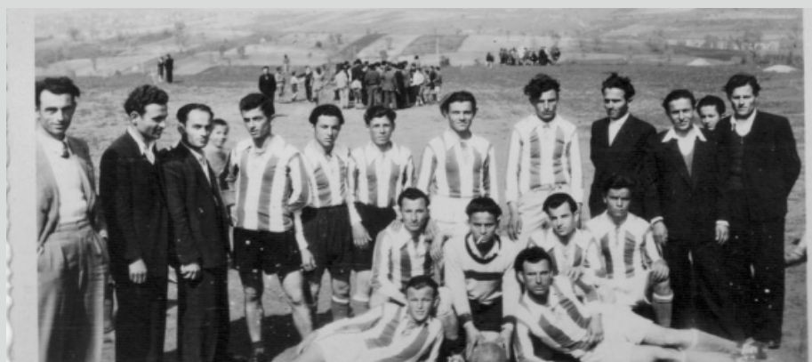
Φωτογραφία Ρετρό από την ομάδα του Εθνικού την δεκαετία 1950